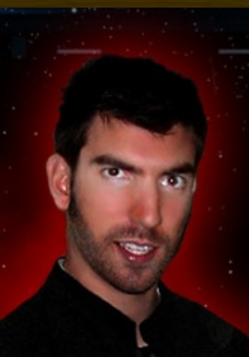
Stacy als Surgant

Brandon verkörperte den verräterischen Betazoiden in den Episoden Dancing in the Dark , Homeport , Vigil , Her Battlelanterns Lit aus Staffel 6 und Heavy Losses aus Staffel 7 von Hidden Frontier . Seine Folgen findet ihr hier: